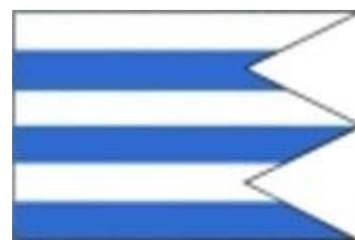
Obrázok 3 Vlajka obce

Zástavu obce Lukov tvorí šesť pozdĺžnych pruhov vo farbách modrej (1/6), bielej (1/6), modrej (1/6), bielej (1/6), modrej (1/6), bielej (1/6). Pomer strán je 2:3, vlajka je ukončená tromi cípmi siahajúcimi do tretiny jej listu.